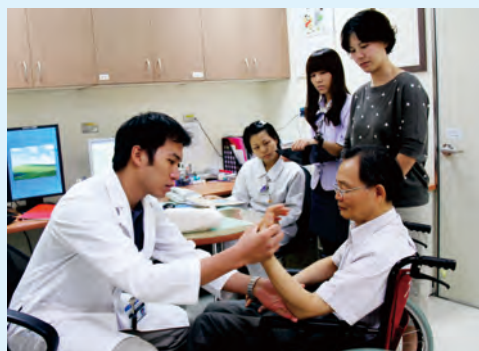
身心障礙整合門診-以復健醫療為例

尚未公佈獲獎名單），預計在年底前參加ISO/IWA1 品質系統及高齡友善健康照護機構認證。參與評核認證雖不一定是醫院經營的品質保證，但是卻是能夠凝聚企業員工對單一事件、人物或歷程的價值判斷，藉由外部評委來審視自身的不足，作為持續性改善的基礎。